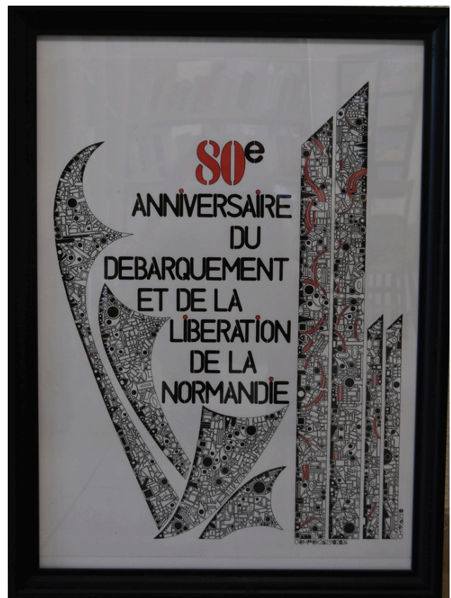
Gros plan de l'affiche de Philippe Grisé